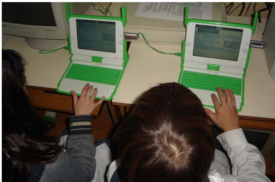
Figura 3: Alumnos de la Escuela Anexa interactuando con las OLPC

Los chicos fueron monitoreados por dos personas que registraron sus acciones y observaron en forma directa cómo los alumnos interactuaban con el sistema. Durante este seguimiento, se trató de asistir al alumno lo mínimo posible, para ver si podía realizar las actividades con el conocimiento informático que ya tenían. La Figura 3 muestra una foto tomada al momento de la evaluación.