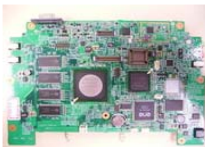
Figura 1 : Imagen del primer prototipo de OLPC

A partir de este logro, dentro del Programa de Investigación que se mantiene en el LINTI sobre “Software Libre”[6], se abrió una nueva línea de investigación para realizar una serie de pruebas e investigar su potencialidad de uso en la realidad educativa de nuestro país, considerando todas las alternativas posibles de implementación.