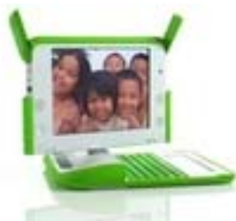
Figura 2: Imagen del segundo prototipo de OLPC

Con la adquisición de estos prototipos, se plantearon varias líneas de trabajo que abarcan desde el desarrollo de software, a la evaluación de los mismos en entornos reales. Estas líneas fueron descritas y publicadas en [8].